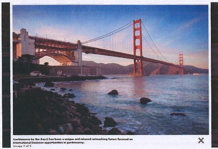
Capture d'écran d'une page du site www.gastronomyfestivals.com. D.R.

La relation passionnelle entre la cuisine française et les Etats-Unis connaîtra un nouvel épisode ce week-end à l'occasion de Gastronomy by the Seine, étape parisienne d'une série mondiale et itinérante de festivals de gastronomie amorcée à San Francisco en 2007, puis à New York. Pendant trois jours, des chefs et des auteurs culinaires d'outre-Atlantique confronteront leurs points de vue avec des chefs français et européens, des historiens, des sociologues, sur le thème "La gastronomie pour tous... ?" Cinq tables rondes, des démonstrations et des ateliers de dégustation se dérouleront sur les Yachts de Paris. Un concours culinaire ouvert aux jeunes chefs de 18 à 26 ans de toutes nationalités, confrontés à la nouvelle cuisine américaine, permettra de mesurer les ambitions de la génération montante. Aux Etats-Unis, les chefs français ont vu leur influence se réduire au profit de cuisiniers américains qu'ils ont pour la plupart formés. A New York, la cuisine est devenue un loisir culturel très tendance, même si les tables sur le pouce et le prêt à manger continuent de prospérer. On s'intéresse plus, comme au Japon, aux produits frais de l'agriculture biologique (Organic) qu'aux avancées de la cuisine moléculaire. Un nouvel épisode d'Il était une fois l'Amérique est-il en train de s'écrire ?